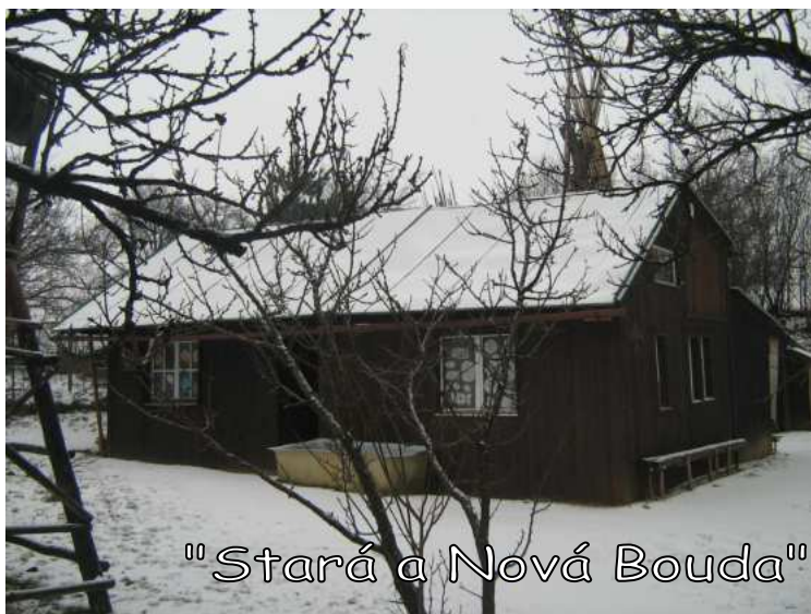
"Stará a Nová Bouda"