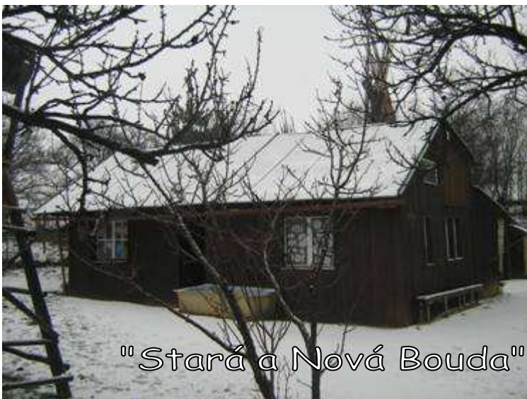
"Stará a Nová Bouda"