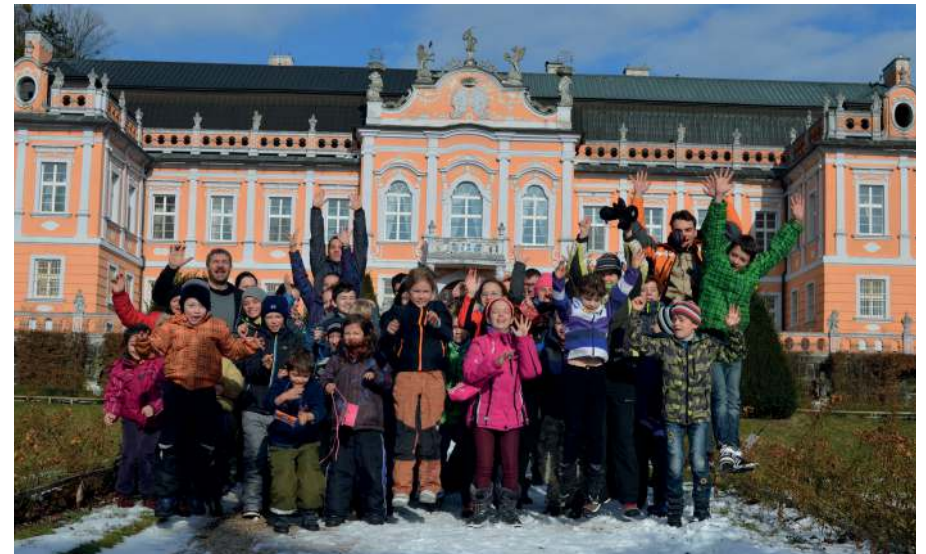
Výprava do Maštálí