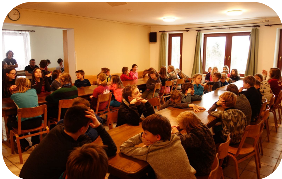
Výprava do Pstruží