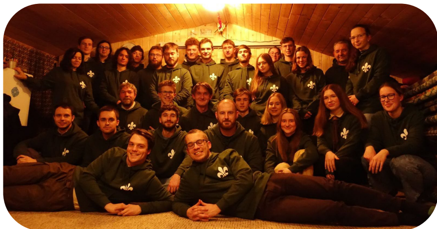
Oddílová rada 2022 Výroční zpráva 2023