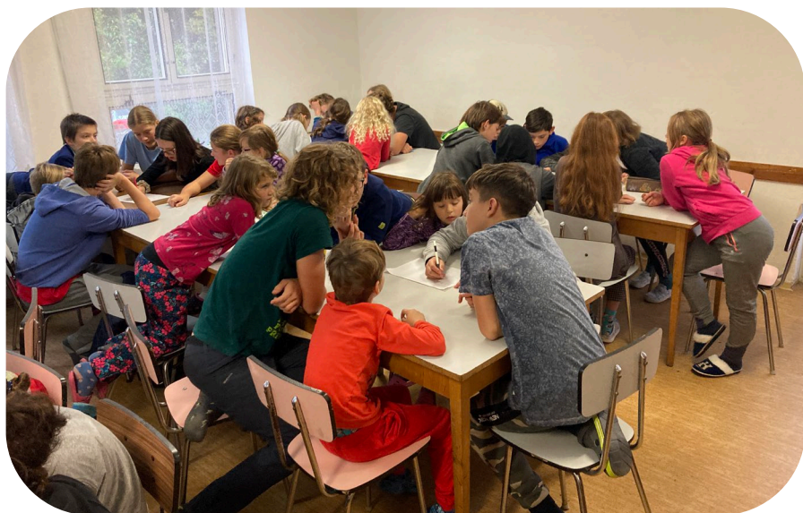
Výprava do Toulcových Maštálí