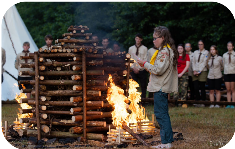
Závěrečný oheň – Tábor 2023