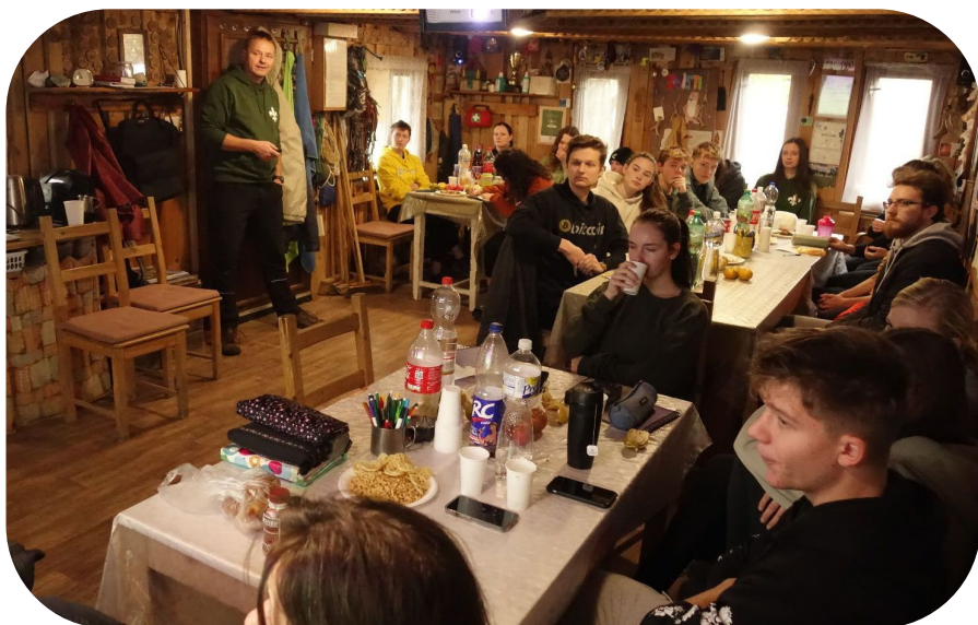
Zdravotnický kurz 2023