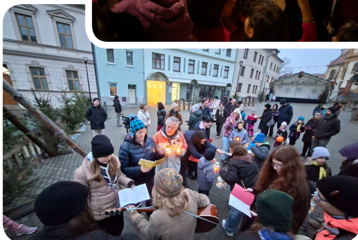
Rukodělky, Vánoční oddílovka, Betlémské světlo