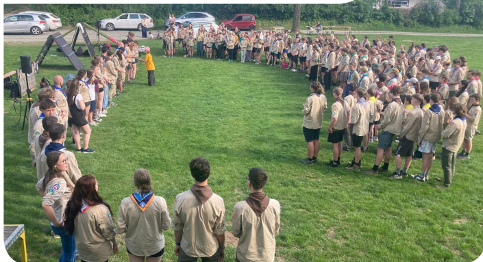
Vítání jara, Výprava do Hodoňovic, Svojsíkův závod